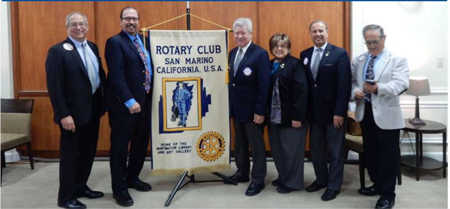
Visita al CR San Marino para exposición de proyectos del CR Tijuana Oeste.