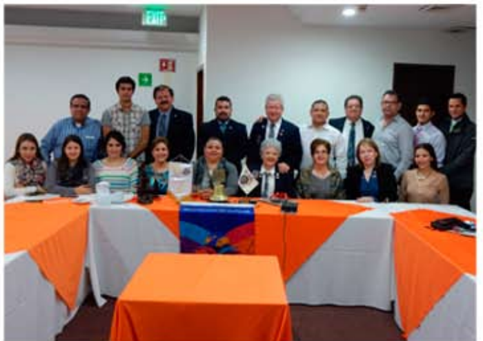
Reunión con Club Rotarac de Obregón Sur en Sedona.