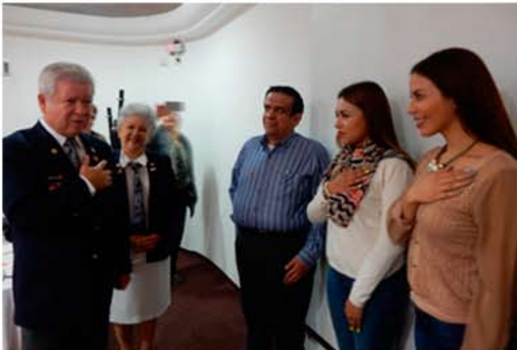
Toma de protesta de nuevos socios del Club Rotaract de Obregón Sur.