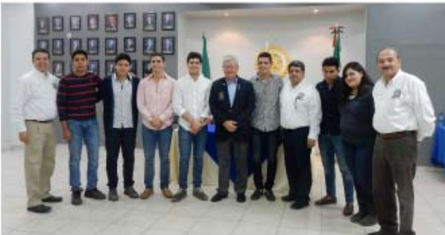
Reunión con Club Rotaract de Navojoa.