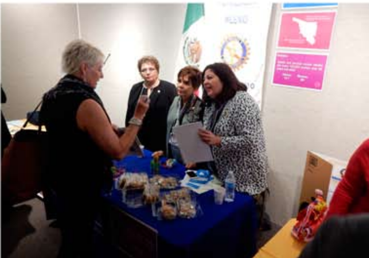
Mesa de negociación de proyectos del CR Hermosillo Milenio.