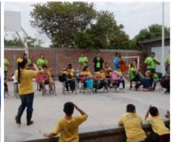
Club de Niños y Niñas de Navojoa en clase de música.