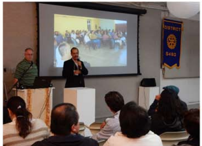
CR la Paz Guaycura exponiendo proyecto de equipamiento en escuela secundaria técnica.JPG