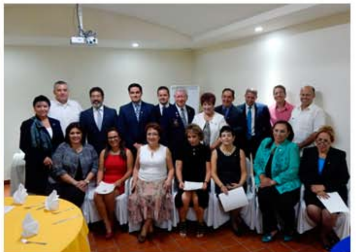
CR La Paz Balandra Renovado.