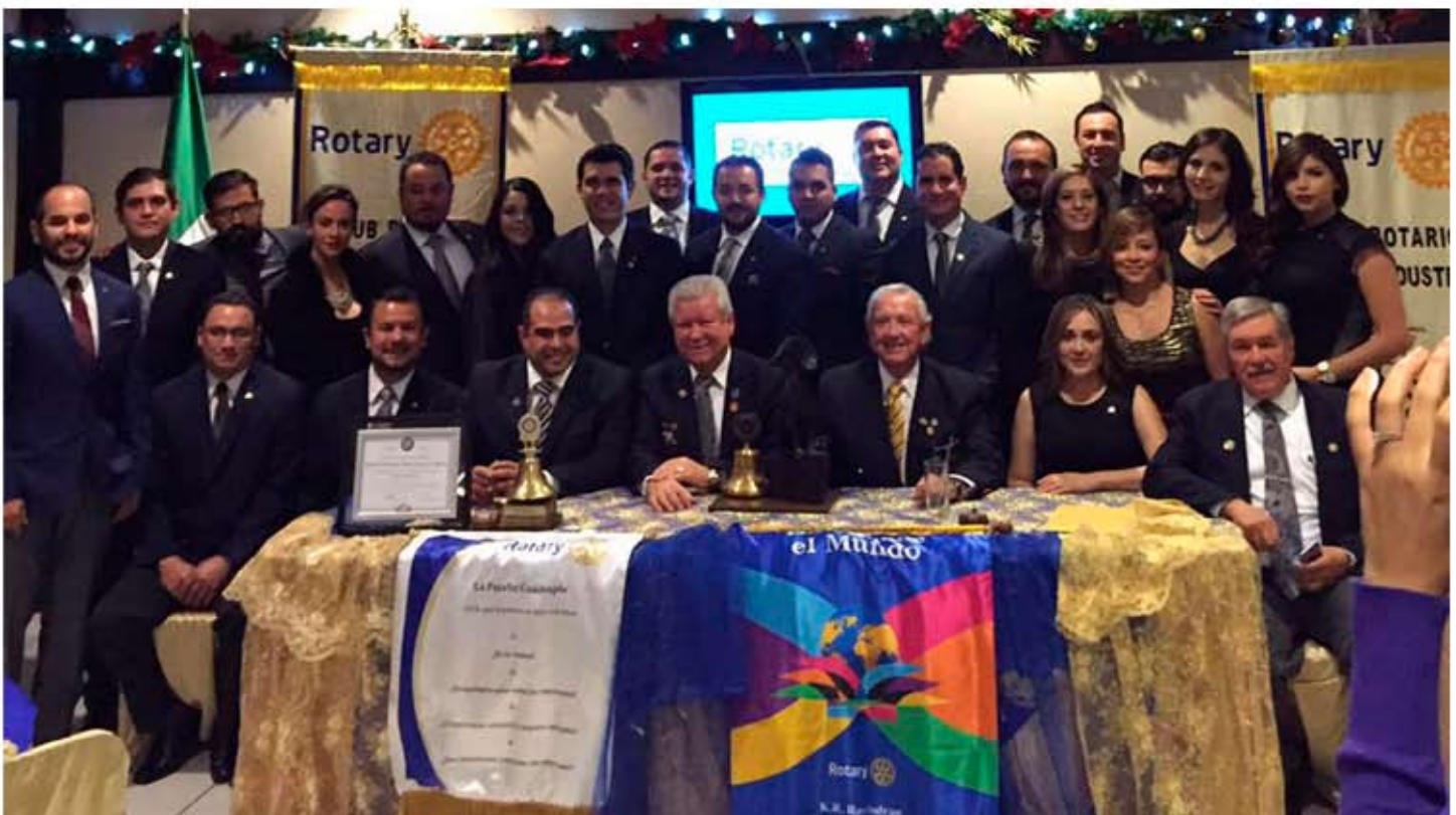
Acta Constitutiva del Nuevo Club Mexicali Empresarial conformado por 33 Socios.