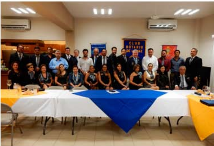
Sesión Rotaria con CR de La Paz.