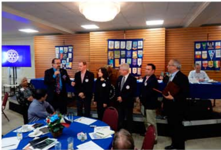
CR San Marino de Los Ángeles con el Gobernador del Distrito.