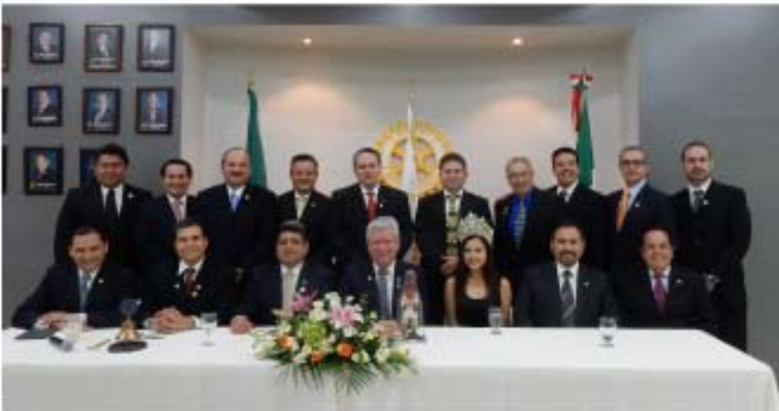
Sesión con Club Rotario de Navojoa.