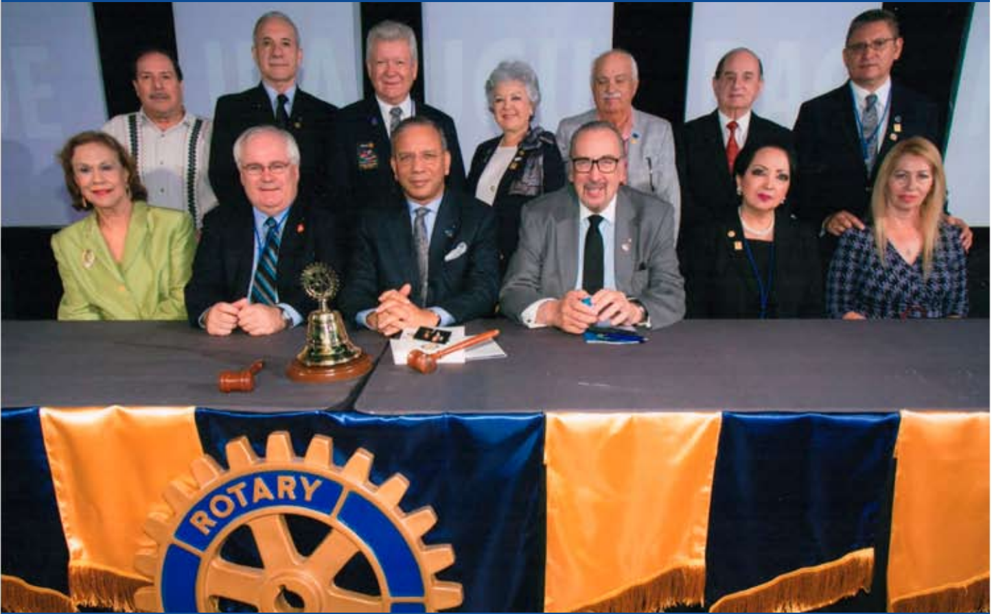
Representantes del Distrito 4100 en el 44 Instituto Rotario Cancún 2015, Zona 21A. 12-14 de Noviembre del 2015.