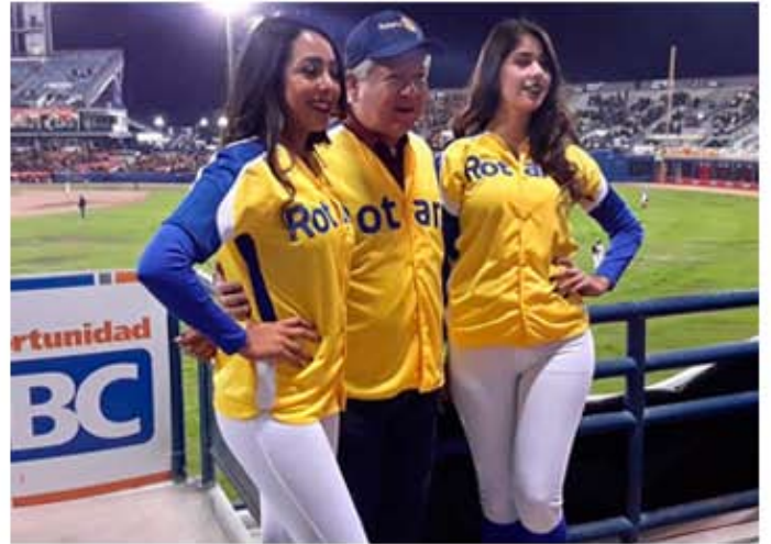
Partido de Baseball con CR Mexicali, Edecanes.