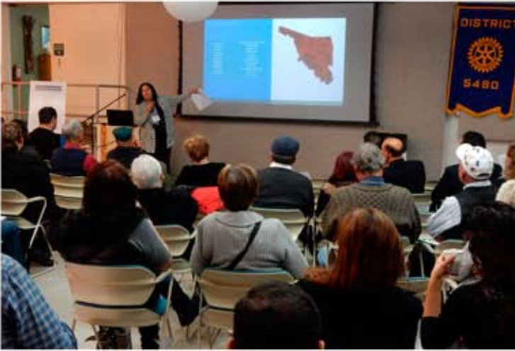
Hmo. Milenio exponiendo proyectos en la 15 feria de proyectos en Sedona AZ.