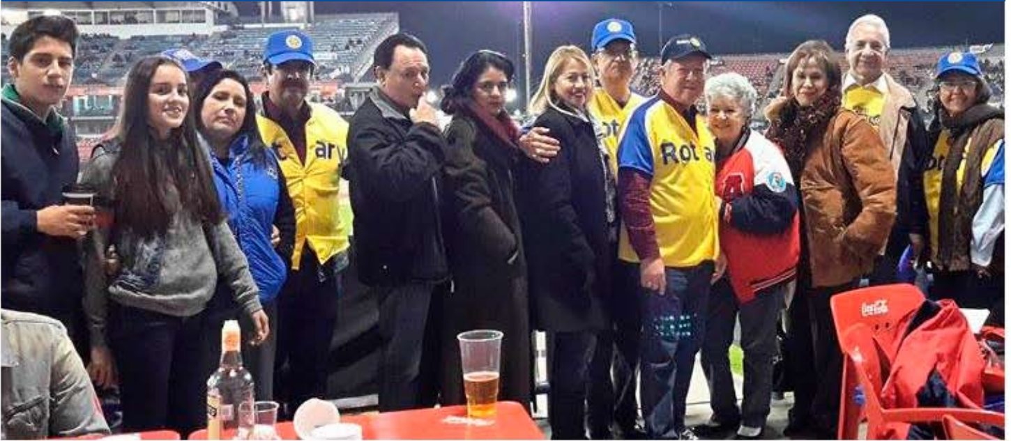
Partido de Baseball con CR Mexicali, Asistentes.