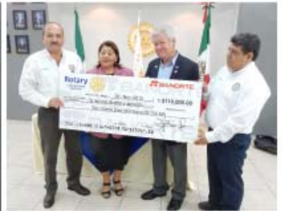
Cheque para apoyo a la creación de bibliotecas para promover la lectura en niños.