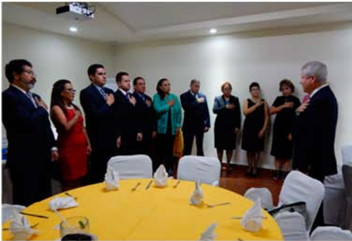
CR La Paz Balandra Toma de protesta de 9 socios.