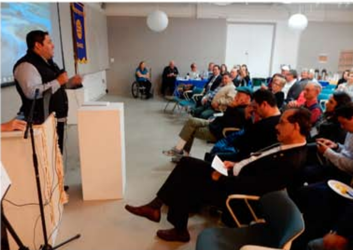
CR Mexicali Industrial, proyecto de nutrición en escuelas primarias.