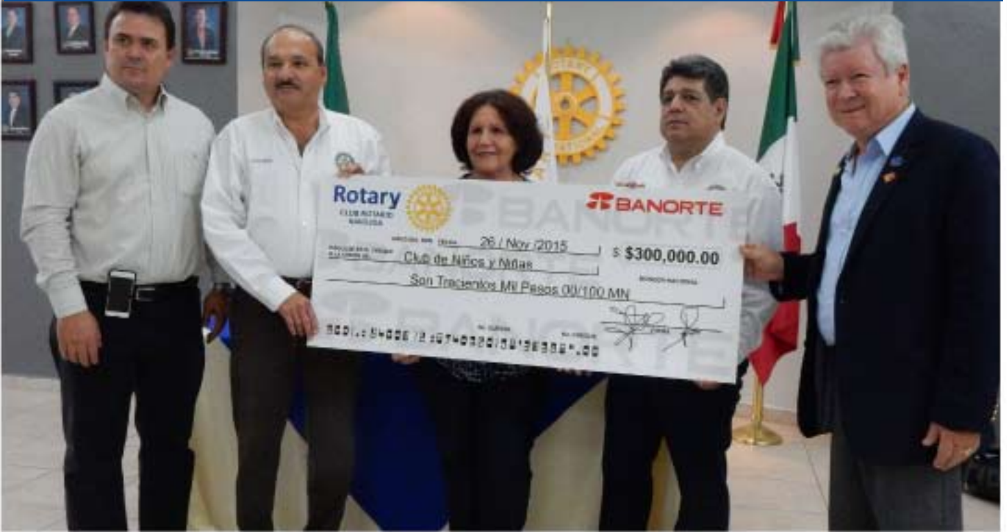
Entrega de cheque al Club de Niños y Niñas de Navojoa por $300,000.