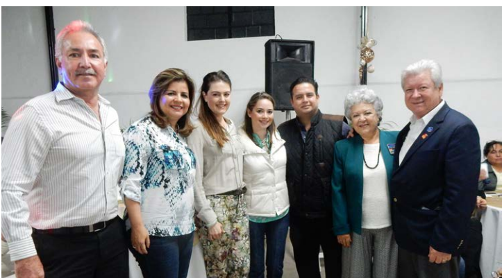
Reconocimiento del DIF al CR Los Mochis Zuaque, con la Pdta. y directora del DIF Municipal.