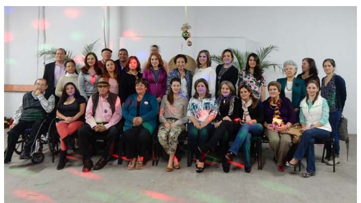
Reconocimiento del DIF al CR Los Mochis Zuaque.