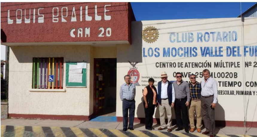
Centro de Atención Múltiple No. 20, CR Los Mochis Valle del Fuerte.