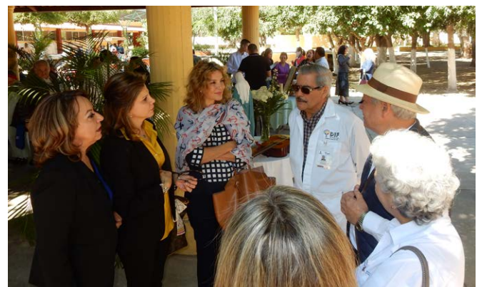
Visita al Asilo de Ancianos Los Mochis Valle del Fuerte.