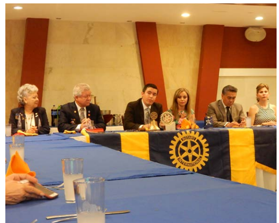
Sesión con el CR Los Mochis, Valle del Fuerte.