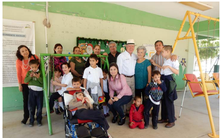
Centro de Atención Múltiple No. 5 con CR Guamúchil.