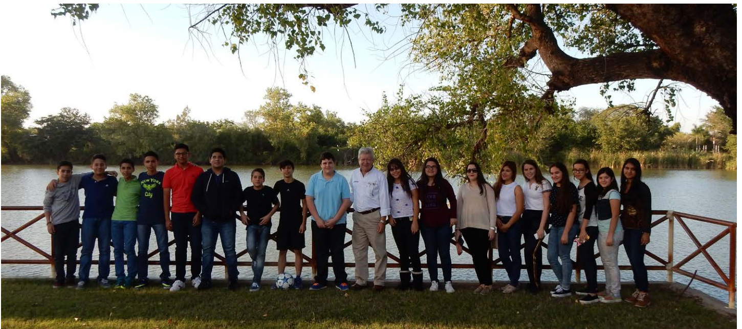
Formación Club Interact de Guamuchil.