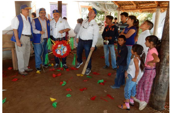
Jornada médica en el campo pesquero El Hecho, con Club Rotario Los Mochis. (Fotografías página completa).