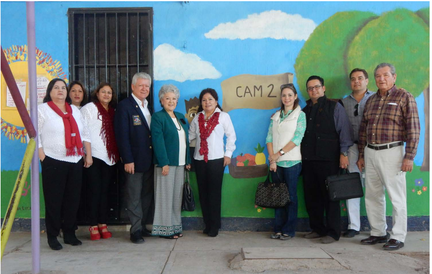
CAM2 Visita al Centro de Atención Múltiple No. 2, LM Zuaque.