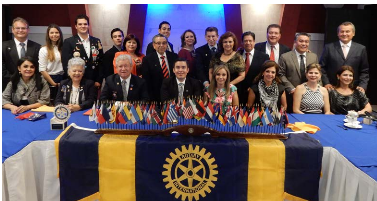
Sesión con el CR Los Mochis, Valle del Fuerte.