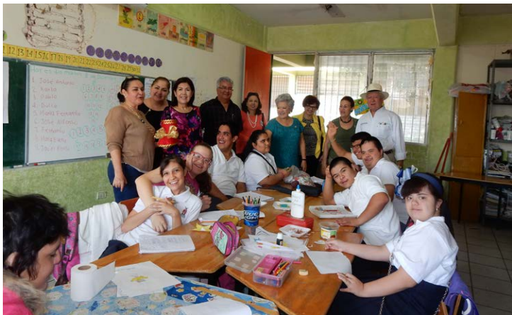
Centro de Atención Múltiple No. 5 con CR Guamúchil.