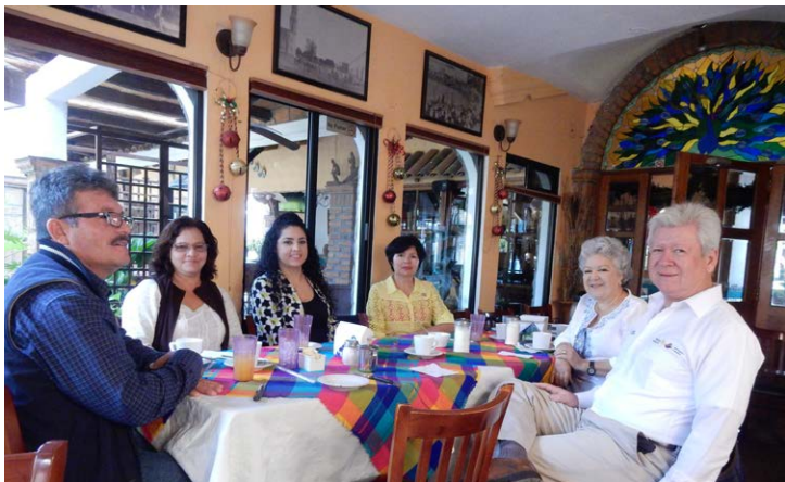
Reunión con Junta Directiva CR El Fuerte.