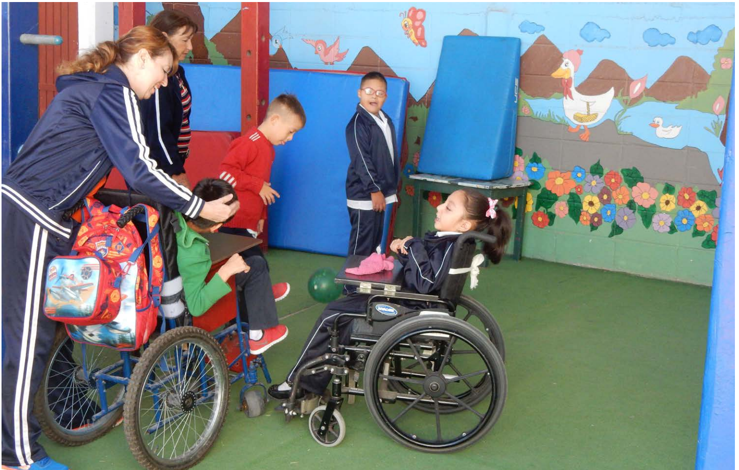
Centro de Atención Múltiple No. 20, CR Los Mochis Valle del Fuerte.