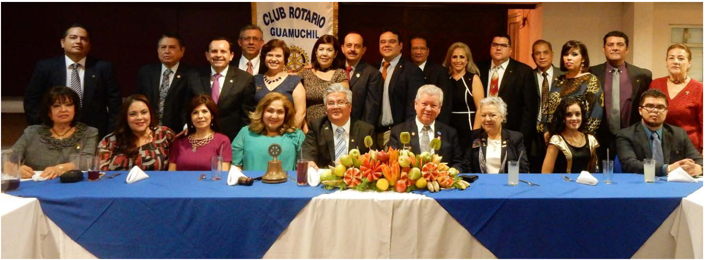
Sesión Club Rotario Guamúchil.