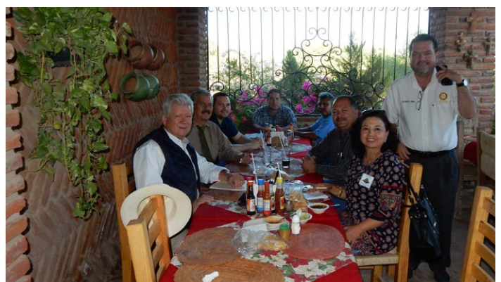
CR Guasave en Sinaloa de Leyva con prospectos Nuevo Club Rotario.