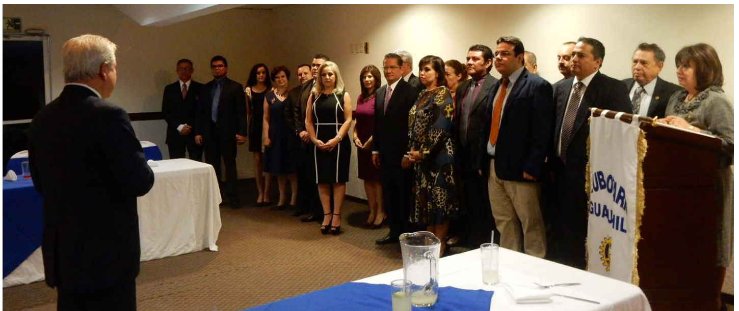
Toma de Protesta de 9 Nuevos Socios del Club Rotario Guamúchil.