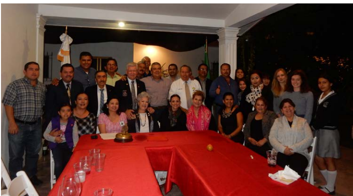
Sesión con Club Rotario Guasave.