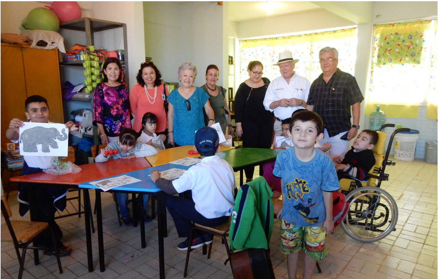
Centro de Atención Múltiple No. 5 con CR Guamúchil.