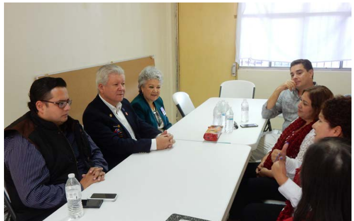
Reunión de Junta de Trabajo con CR Los Mochis Zuaque.