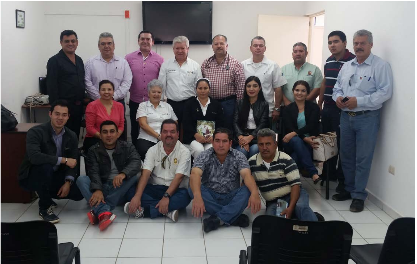
Nuevo Club Rotario Sinaloa de Leyva.