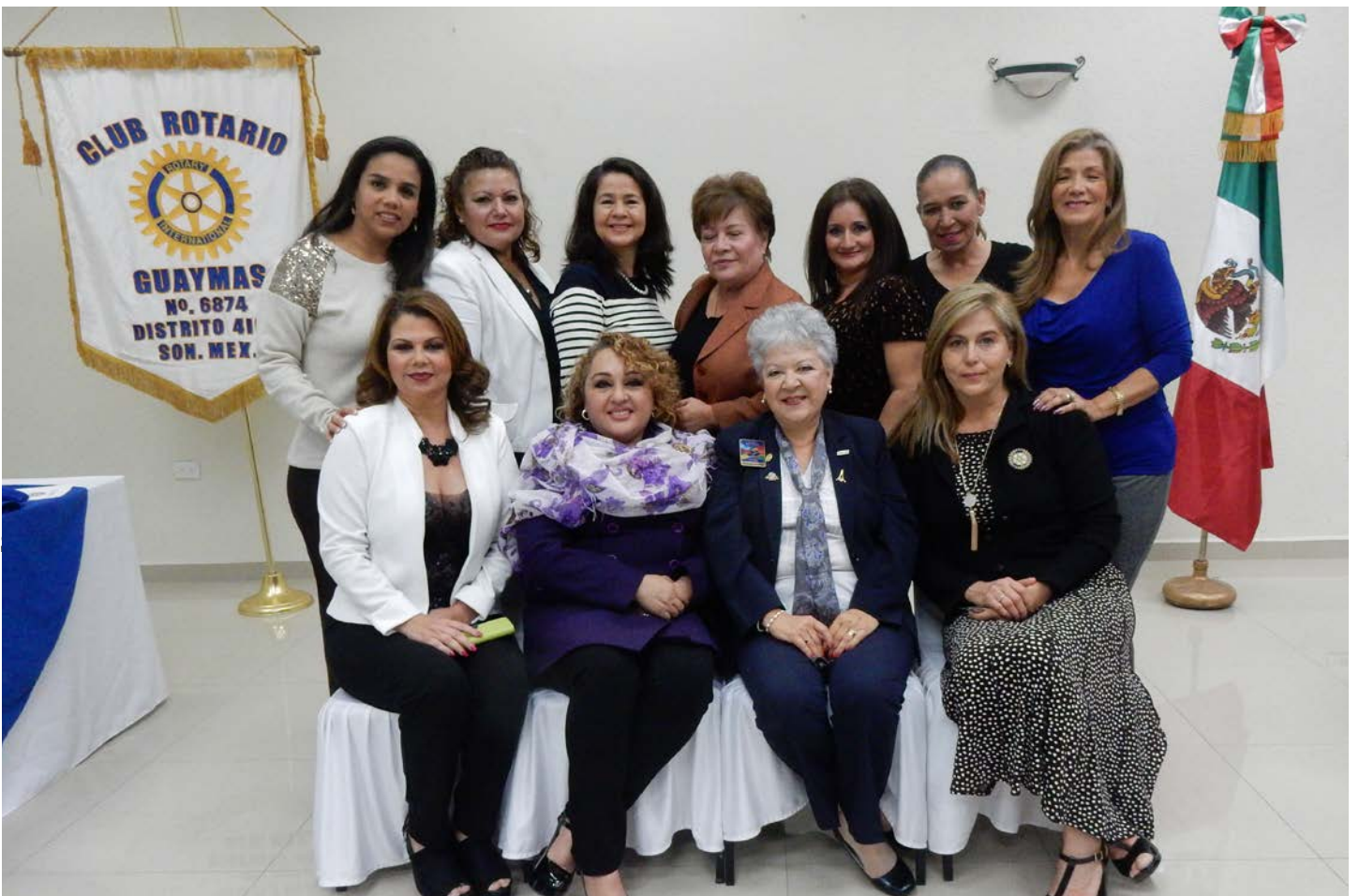
Visita oficial con el Club Rotario Empalme y los estudiantes de intercambio (Página completa).