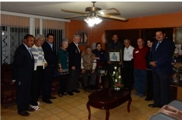
Visita Oficial Club Rotario Empalme.