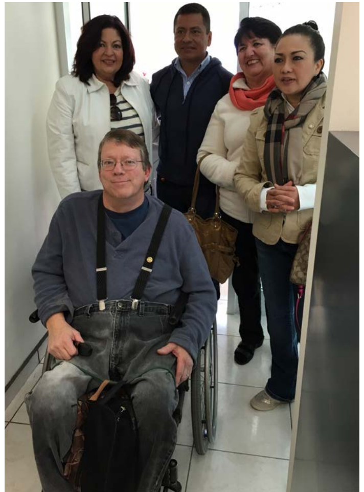
Rotarios de Canadá y Club Hmo. Milenio visitan el Centro de Salud No. 2 del Poblado Miguel Alemán para Jornada Dental.