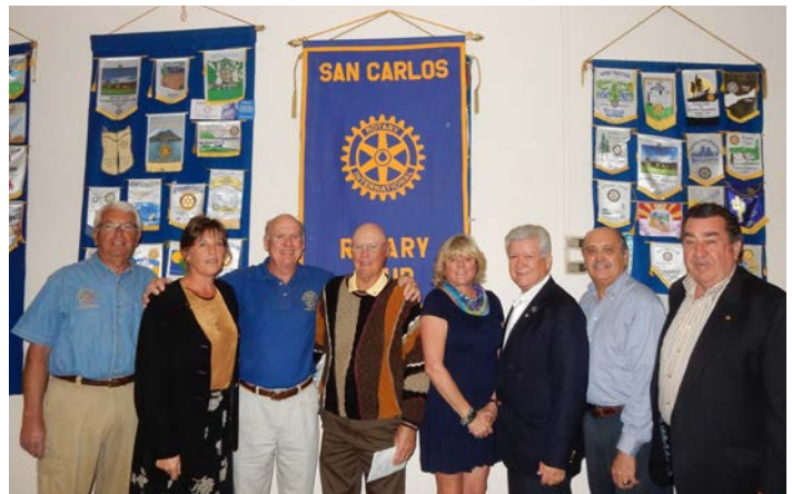
Club Rotario San Carlos, Reunión con Junta Directiva.