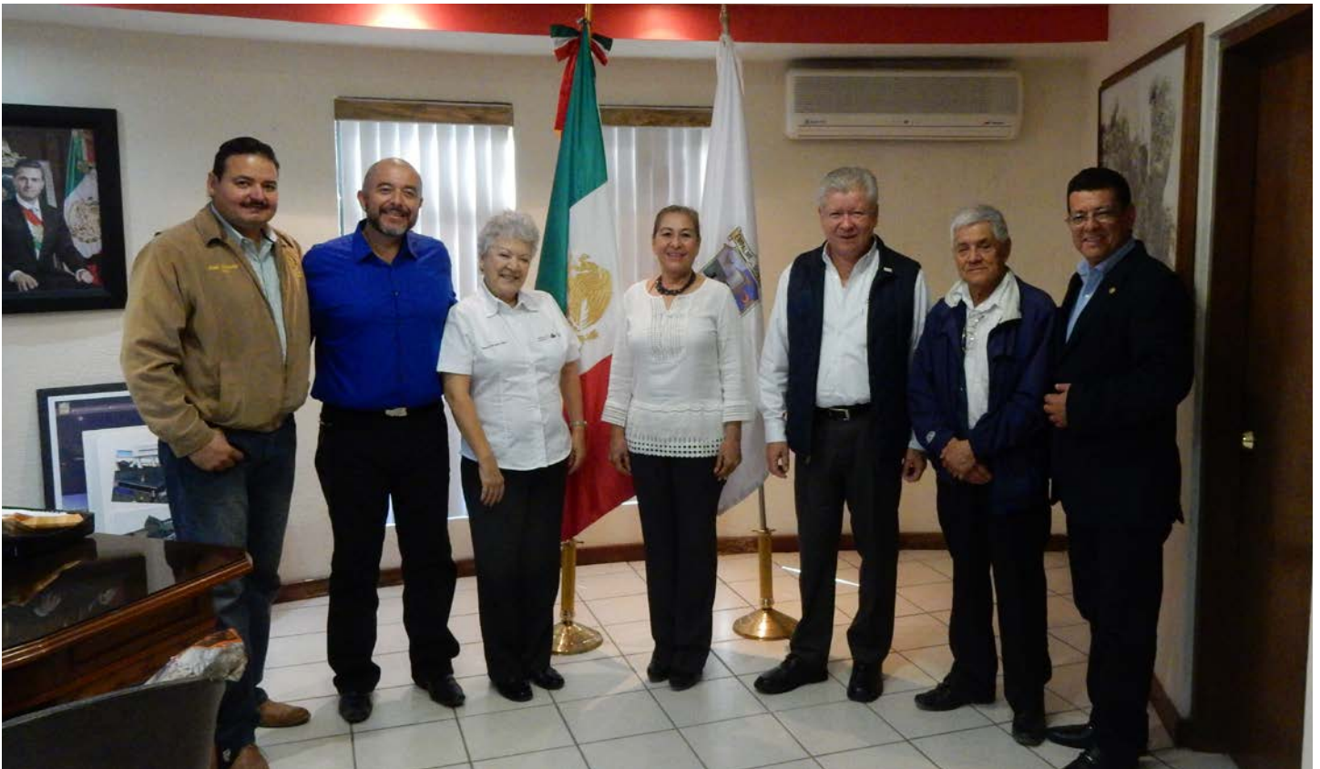
Visita Oficial Club Rotario Empalme.