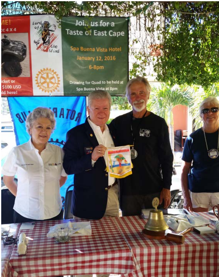
Evento con Club Rotario Los Barriles.