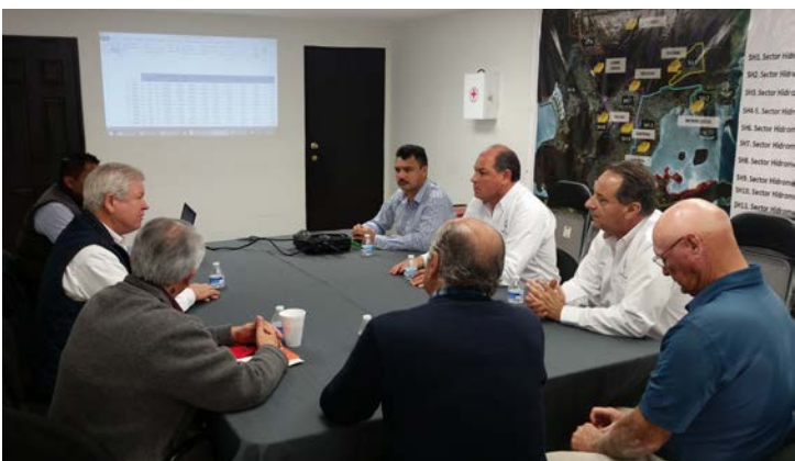
CR San Carlos Reunión Comisión Estatal del Agua de Son.