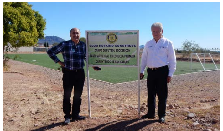
CR San Carlos construye campo de futbol soccer en Esc. Prim. Cuauhtémoc de San Carlos.