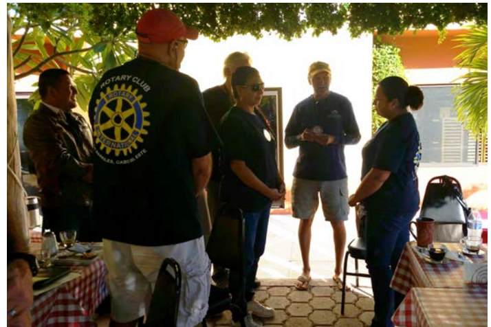
Visita Oficial Club Rotario Los Barriles.