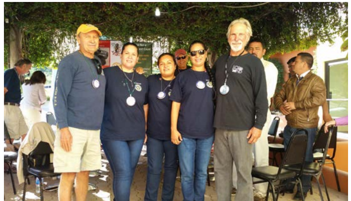
Visita Oficial Club Rotario Los Barriles.