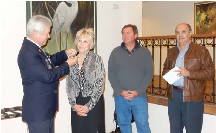
CR San Carlos, Toma de Protesta 2 Nuevos Socios.