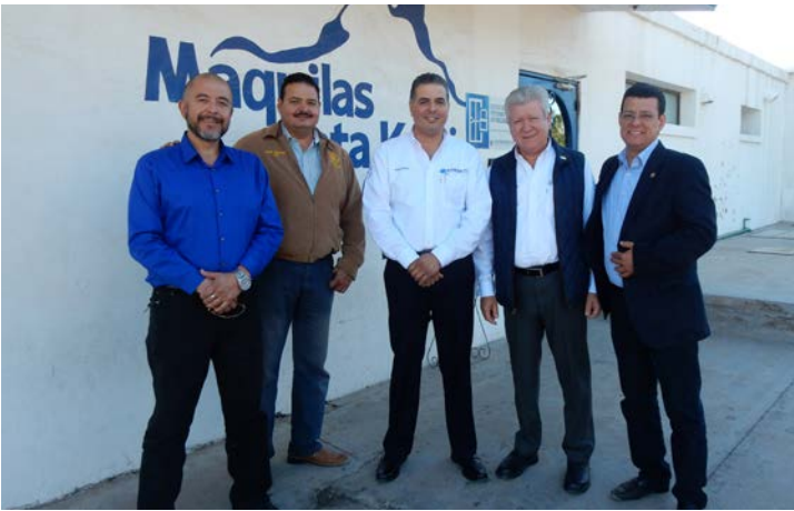
Visita Oficial Club Rotario Empalme.