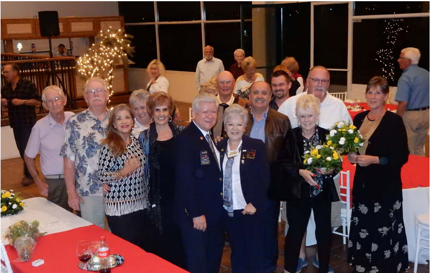
Club Rotario San Carlos Sesión Ordinaria.