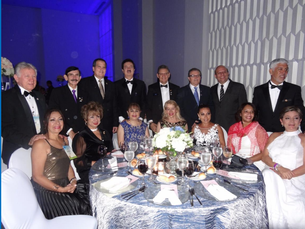
Cena de clausura