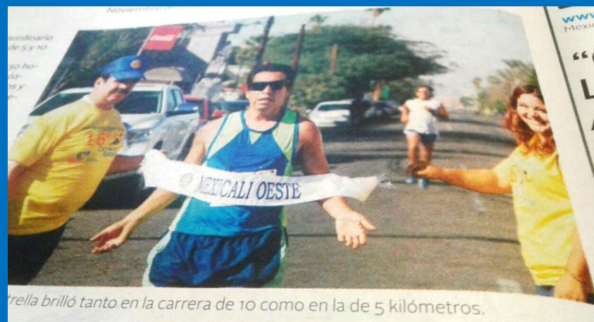
trella brilló tanto en la carrera de 10 como en la de 5 kilómetros.