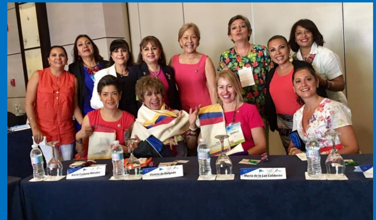
Esposas de los Gobernadores electos