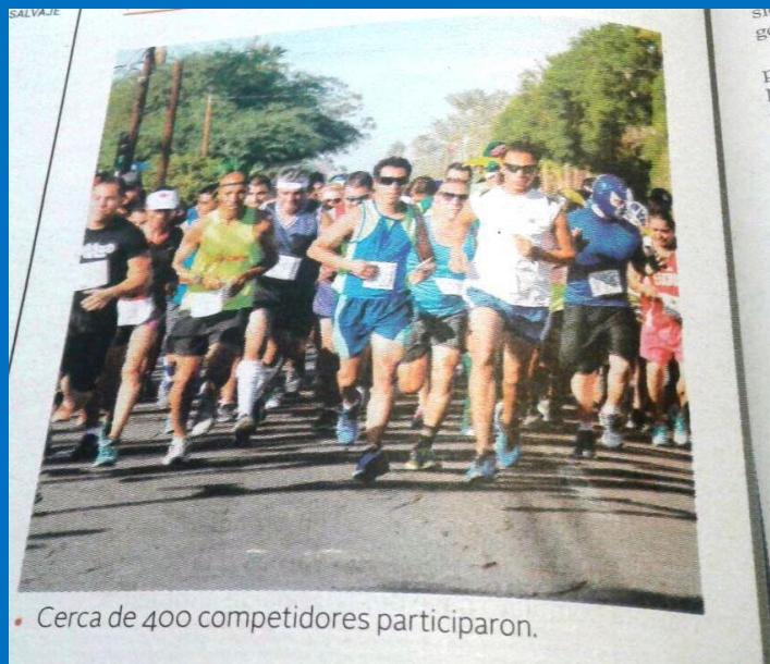
• Cerca de 400 competidores participaron.