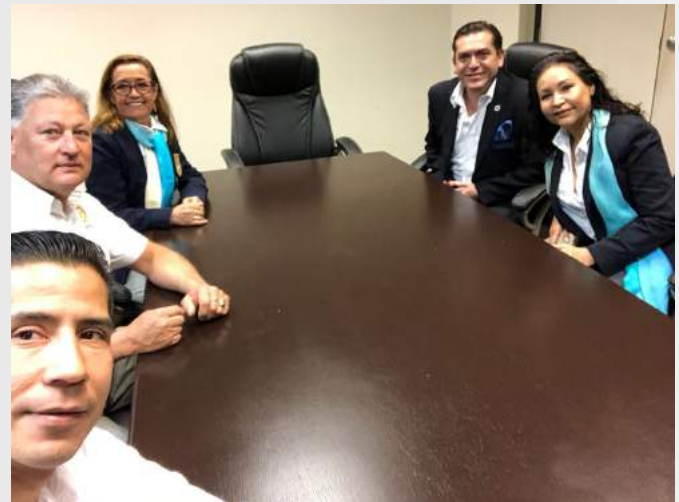
ENTREVISTA CON EL PRESIDENTE MUNICIPAL DE ENSENADA, BC.