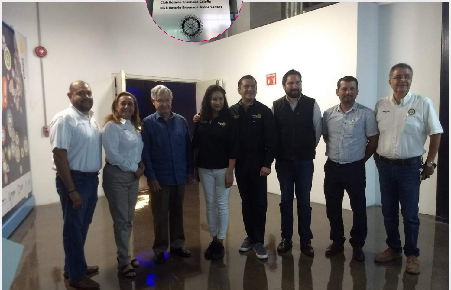
VISITA AL MUSEO EL CARACOL.