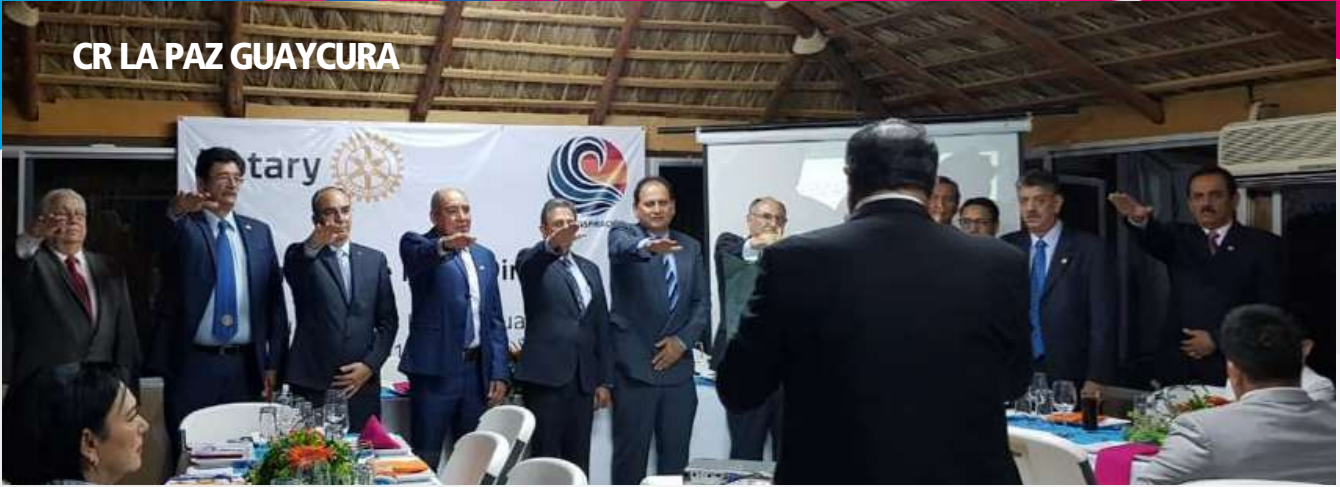
CR LA PAZ GUAYCURA