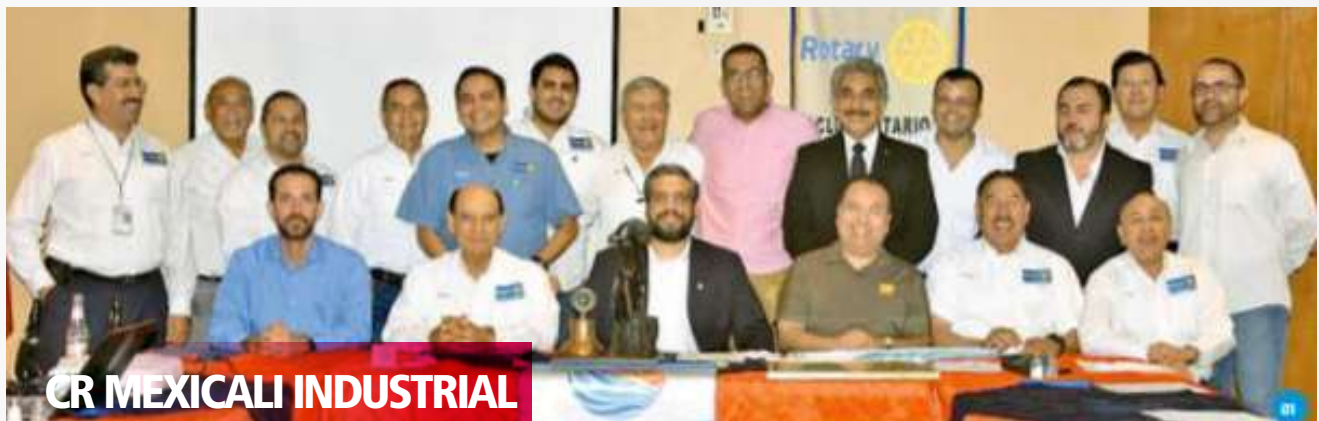
CR MEXICALI INDUSTRIAL