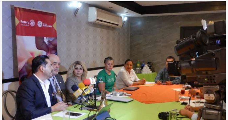
Rueda de Prensa, 04/07/2018, Los Mochis, Sin.