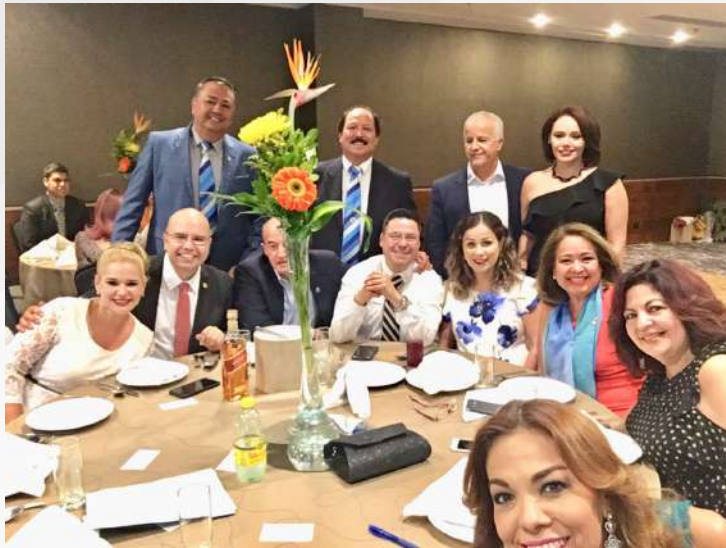
CR HERMOSILLO DEL DESIERTO