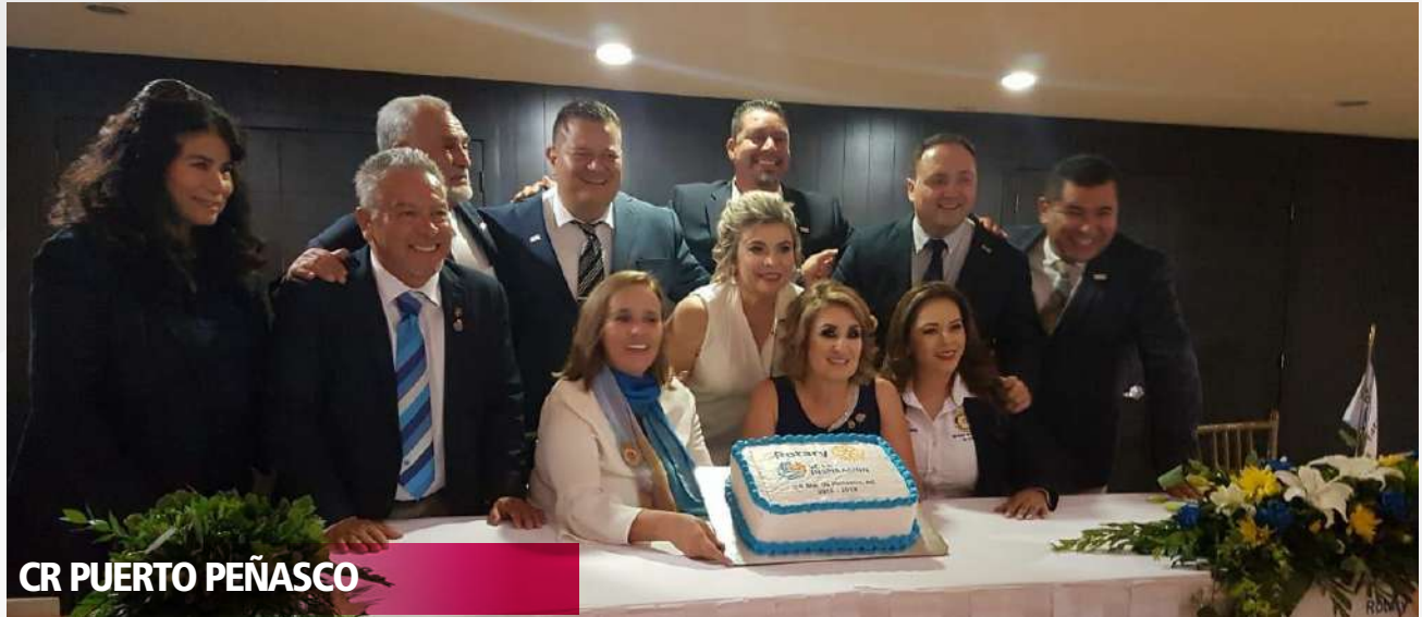
CR PUERTO PEÑASCO