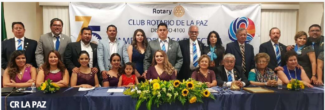
CR LA PAZ