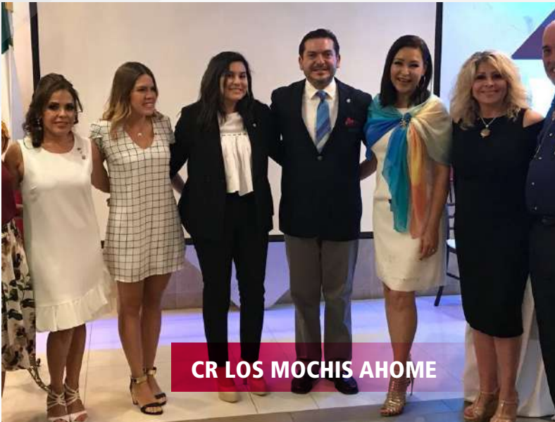
CR LOS MOCHIS AHOME