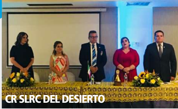
CR SLRC DEL DESIERTO