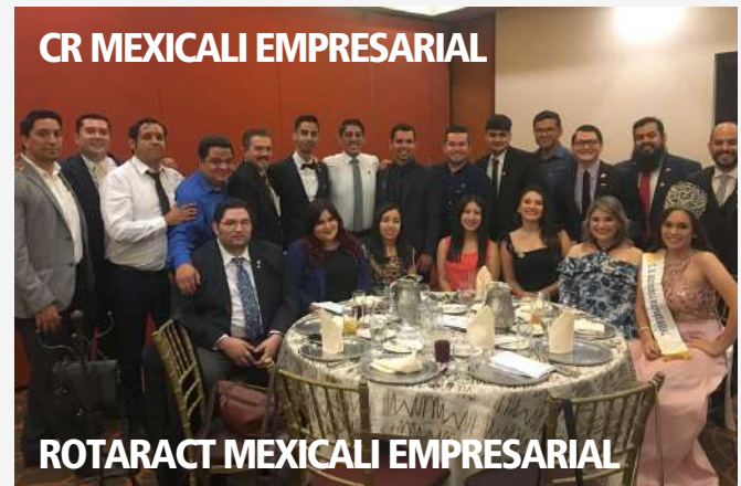
CR MEXICALI EMPRESARIAL