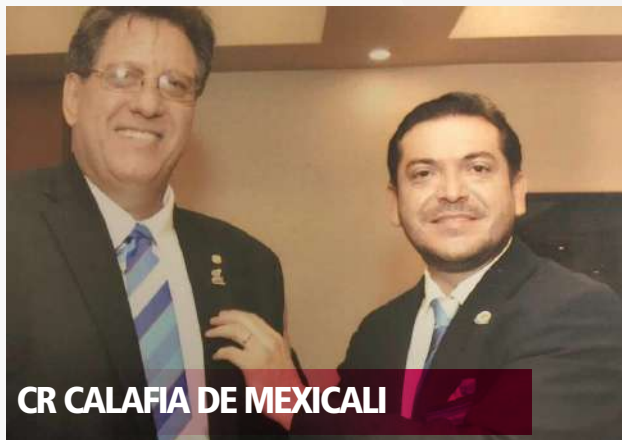
CR CALAFIA DE MEXICALI