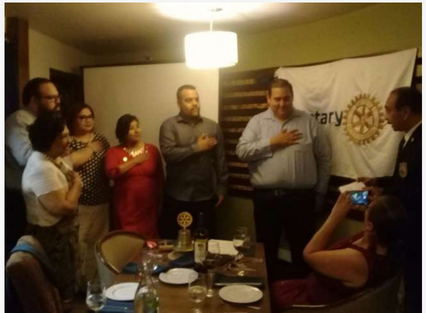
CR TIJUANA KUMIAI