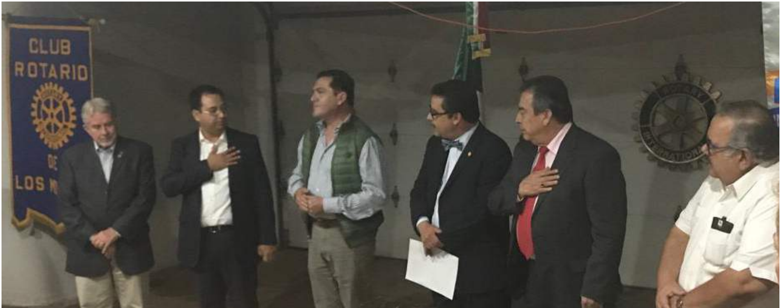
Gobernador Cristóbal Soto toma protesta a dos nuevos socios del Club Rotario Los Mochis.