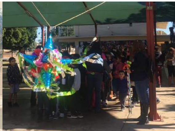
Pastorela y Posada con la Comunidad de la Colonia Altar en san Luis RC Sonora con apoyo de Interact y CBTIS 33 con Club Rotario San Luis del Desierto AC