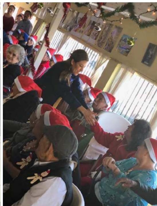
Damas Rotarianas del Club Rotario Tijuana, visitando la Casa de los Abuelitos AC