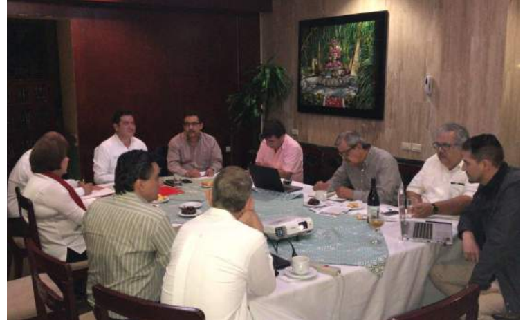
Gobernador Cristóbal Soto en Visita Oficial con los integrantes del Club Rotario Los Mochis.