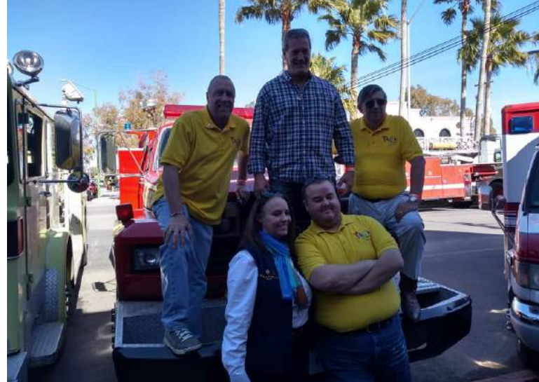
Entrega de tres unidades al Departamento De Bomberos Puerto Peñasco que se pudo lograr con el apoyo del Rotary Club of Surprise y el H Ayuntamiento de Puerto Peñasco. Para el pueblo de Puerto Peñasco.