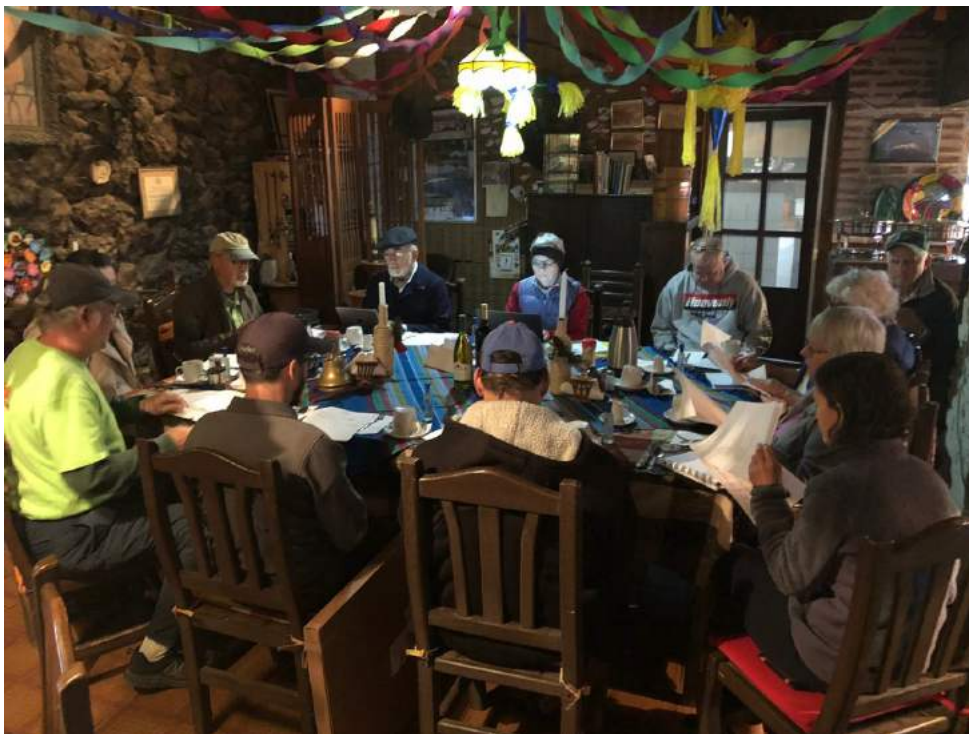
Junta ordinaria del Club Rotario Mulegé AC y visita de jóvenes Rotaract Ensenada.