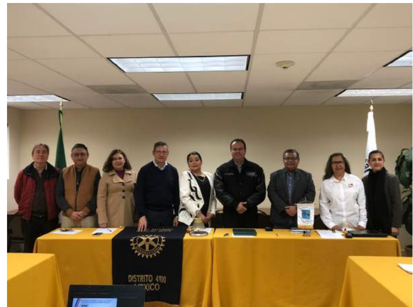
Firma de Convenio de vinculacion con la FCA de la UABC