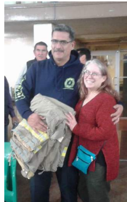
Sesión de Club Rotario Nogales Industrial con rotarios de Canadá. Distrito 4100 y 7080 Shoe Boxes Project.