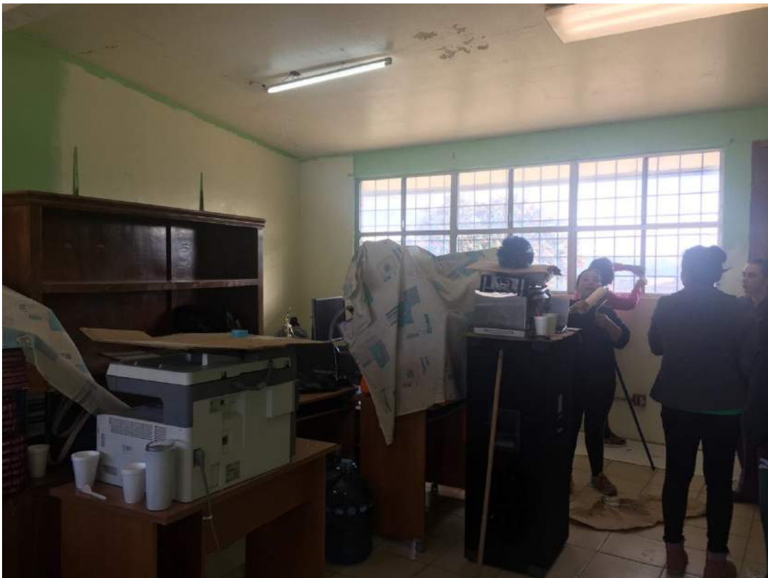
CR Tijuana Oeste Siembra de arbolitos e inicio de rehabilitacion de la sala de computo de la Esc. Primaria Elena Rivera Sanchez en Tijuana. Participacion de los inbouds y algunos socios del club.