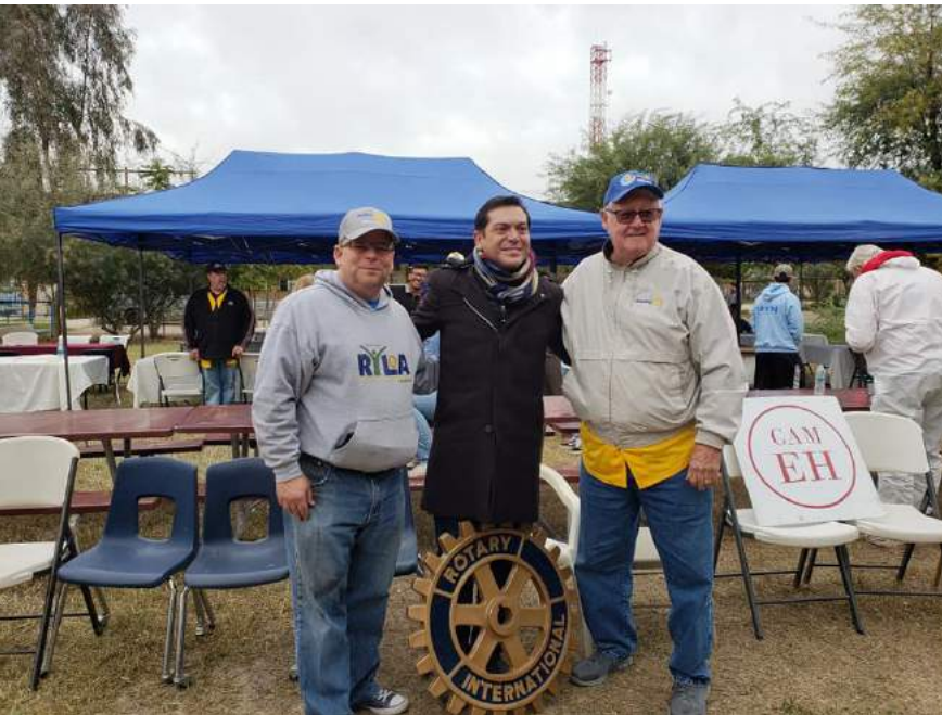
Gobernadores de Distrito, 5300, 4100 y 5330. EE.UU. Y México