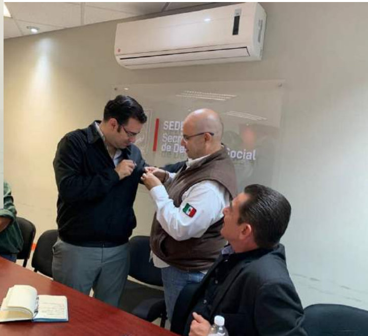
Reunión y abotonamiento al Secretario de SEDESSON y Directora de atención ciudadana del Gobierno de Hermosillo por nuestro club, organizando nuestra 18va jornada Optométrica VOSH!