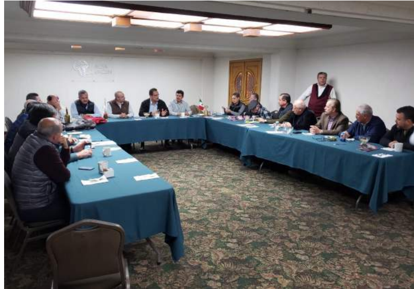
Club Rotario Hermosillo Pitic en sesión con orador huésped invitado, el Secretario de Seguridad Pública del Municipio de Hermosillo