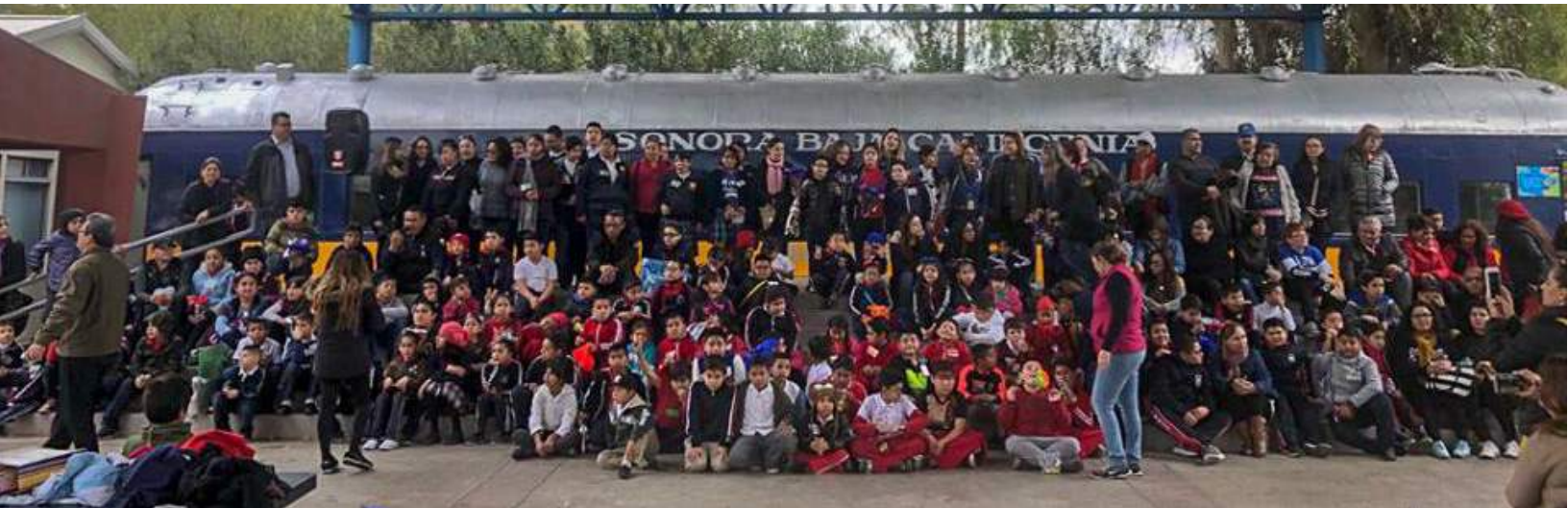
Evento USAER 3 entrega de donativos varios en el Museo Sol del Niño.