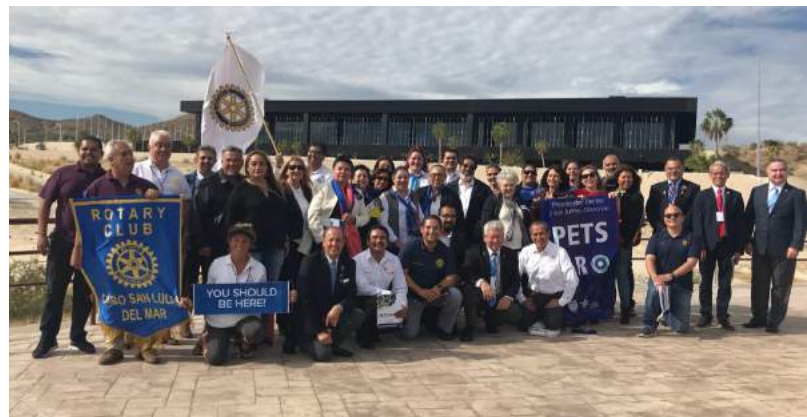
PETS/ ILR SAN JOSÉ DEL CABO