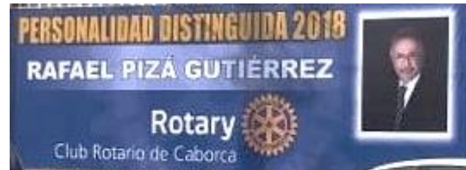
Imagen depurada impresa sobre lona, elaborada y colocada por David Meneses en la Calle Obregón.