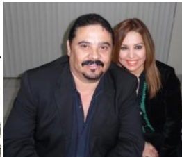
Ganador de la Rifa: "Convención" Los Mochis"