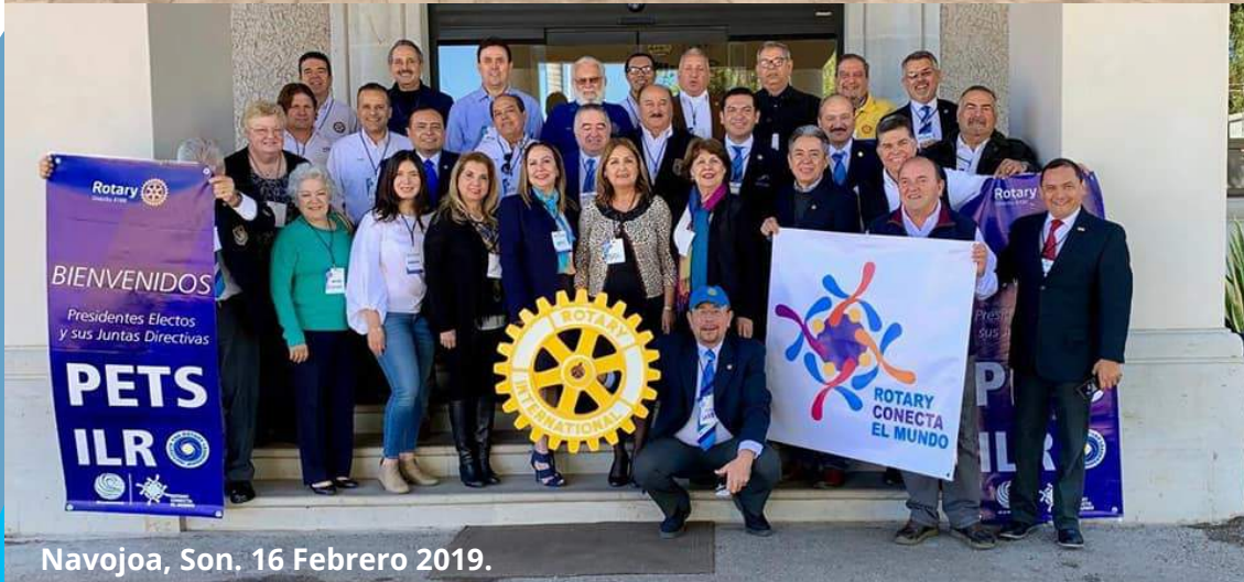
Navojoa, Son, 16 Febrero 2019.