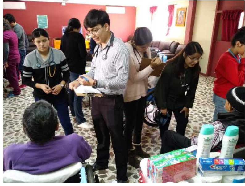
Club Rotario Mexicali Oriente, en visita al Asilo de ancianos "Casa del abuelo Cachanilla" realizaron la entrega de alimentos, productos de limpieza general, productos de aseo personal y medicamentos.