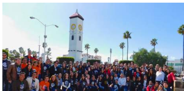
President Elect Training Seminar 2019: Ensenada, B.C.