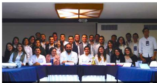
3ra Asamblea de Presidentes y Funcionarios: Ensenada, B.C.