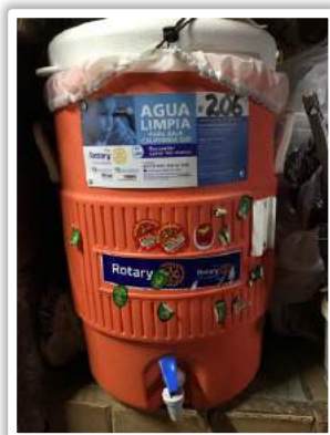
Rotary está presente.