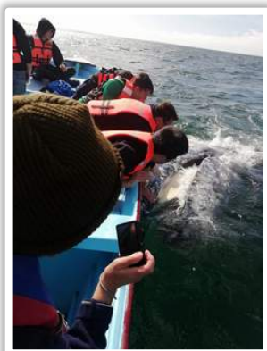
Ballena dando su mejor sonrisa.

Tuvieron la oportunidad de visitar las pinturas rupestres realizadas hace más de 7500 años y vieron cómo rotary trabaja en lugares apartados apoyando a familias a tener agua potable.