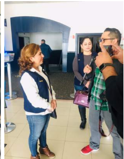
Cinepolis y el Club Rotario San Luis Río Colorado del Desierto haciendo felices a los niños del CAM 42, 60, 38 y 10, USAER y Escuela María Mendoza Gómez.