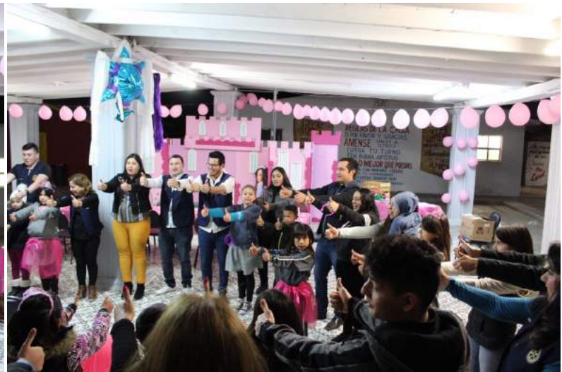
Club Rotario San Luis Río Colorado del Desierto en coordinación del Club Rotaract del Desierto, pasando un momento agradable con los niños de la Casa Hogar Bethel, ofreciéndoles piñata y dulces.