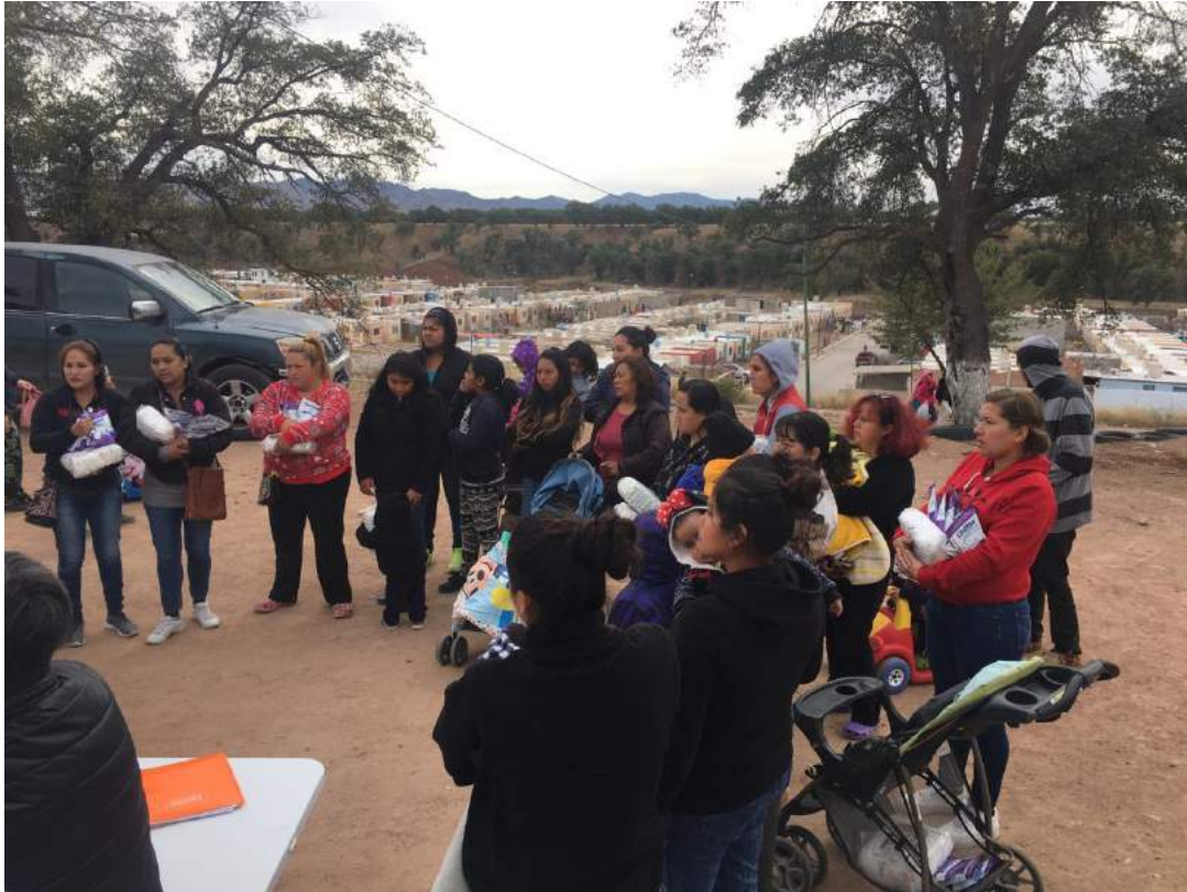
Club Rotario Nogales Sur junto con compañeros Rotarios de Arizona entregando pañales y leche a personas necesitadas.