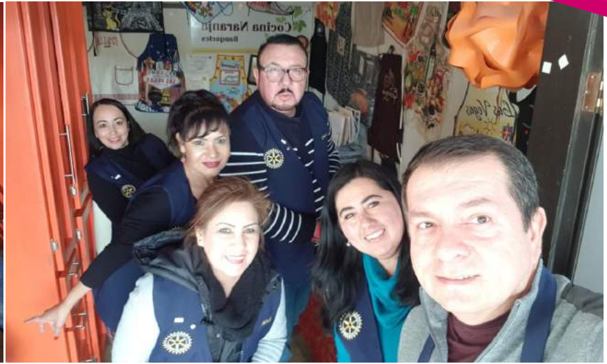
Venta de pollo migñon, como evento recaudatorio del Club Rotario San Luis Río Colorado del Desierto.