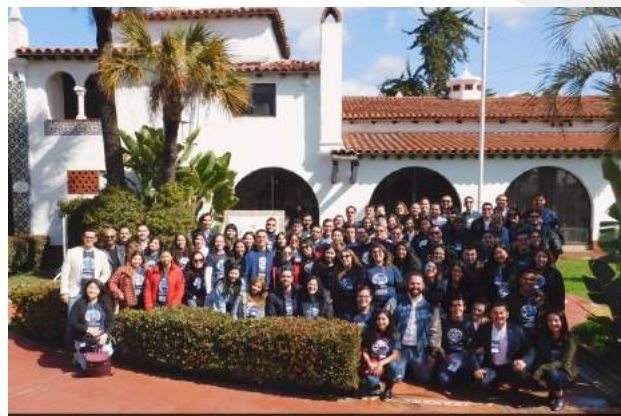
President Elect Training Seminar 2019: Ensenada, B.C.

No importa cómo sirva, celebre o regale esta Semana Mundial de Rotaract, comparta cómo está tomando acción con #WorldRotaractWeek.