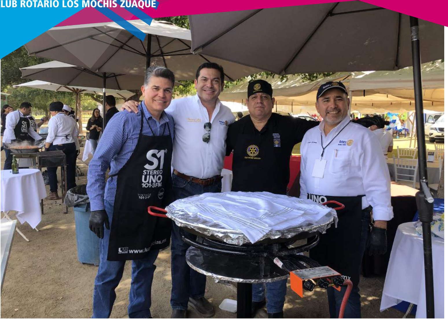
Club Rotario Los Mochis Zuaque organizó el Paella Fest 2019 como evento recaudatorio en beneficio de los niños del CAM No. 2. Contaron con la compañía del Gobernador del Distrito Cristóbal Soto.