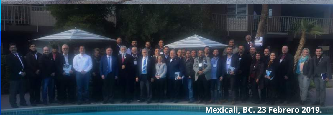
Mexicali, BC. 23 Febrero 2019.