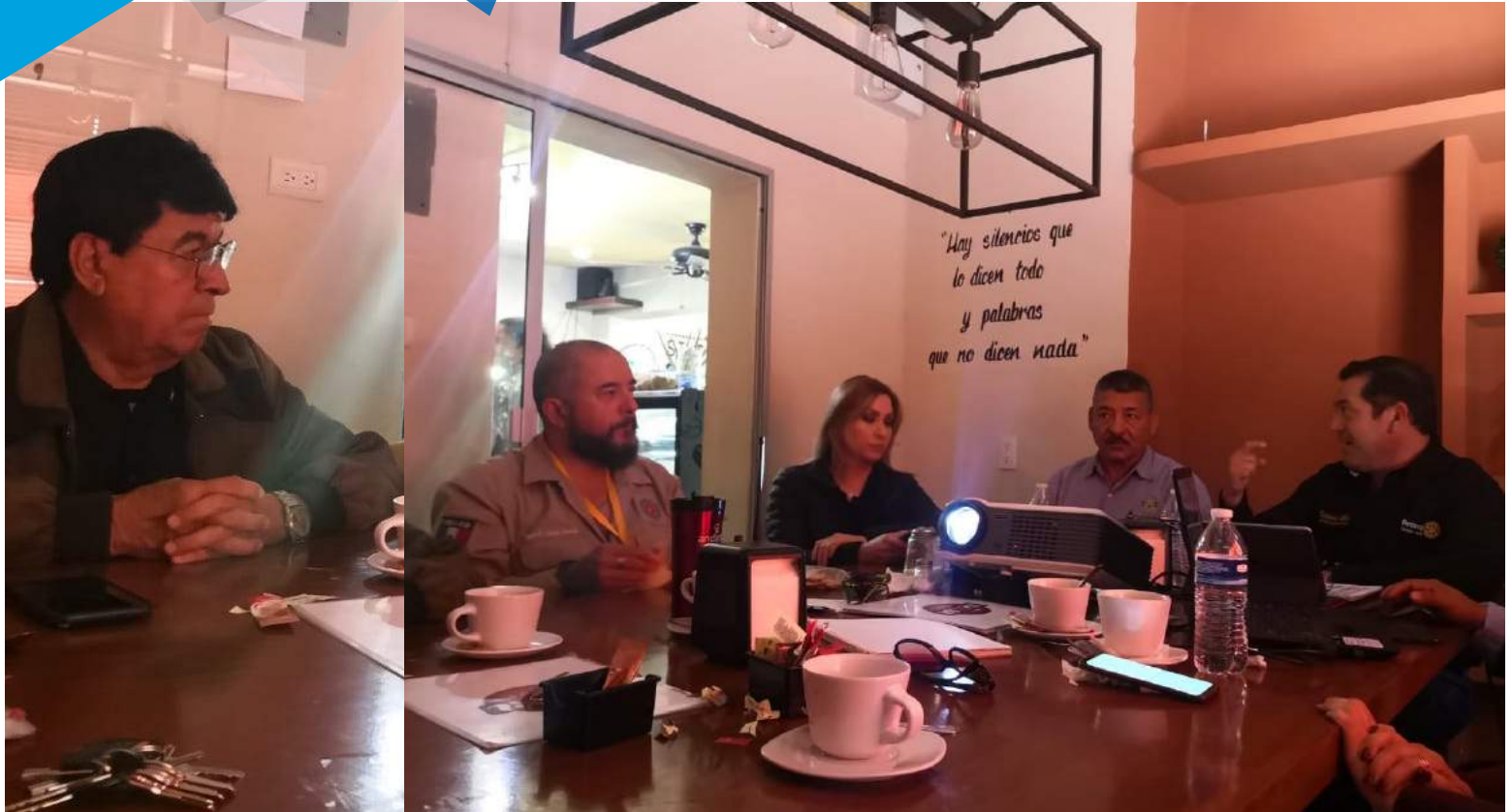
CLUB ROTARIO EMPALME