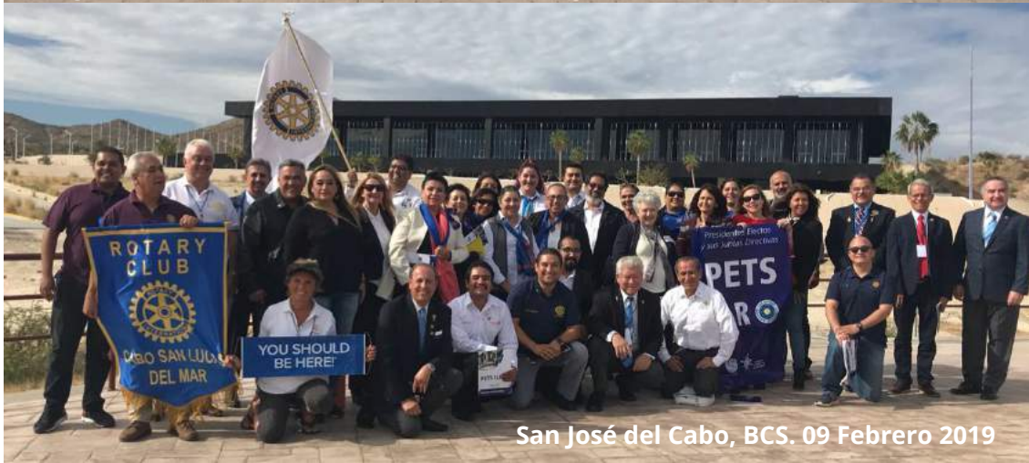
San José del Cabo, BCS. 09 Febrero 2019