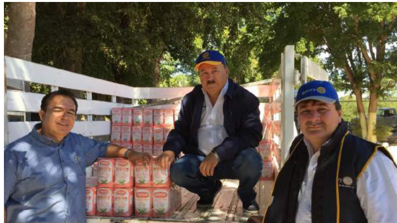
Jornada médica asistencial en la Comunidad Campo Gastélum Ahome, donde se beneficiaron con 200 consultas médicas, entrega de despensas y una tonelada de minsa. Todo gracias al arduo trabajo de los socios del Club Rotario Los Mochis.